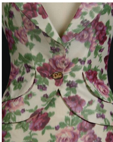
Le tailleur de John Galliano pour Christian Dior (1998) rejoint les salles du musée Christian Dior

L'exposition Dior en roses est à visiter jusqu'au 31 octobre 2021. Jusqu'au 30 septembre, ouverture tous les jours de 10h à 18h30. A partir du 1 er octobre, ouverture du mardi au dimanche de 10h à 12h30 et de 14h à 18h. A noter que le musée sera exceptionnellement fermé le 27 septembre et le 2 octobre.