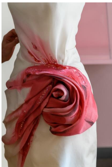
La robe "Olga Sherer inspired by Gruau" rejoint les réserves

De nouvelles robes à découvrir dans l'exposition Dior en roses