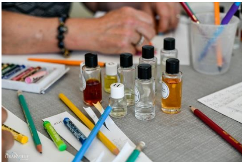
L'atelier "Apprenti Parfumeur"

Tous les mercredis, à partir du 27 octobre, à 10h30 ou à 14h30.