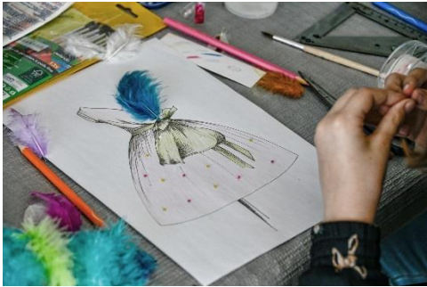
L'atelier "Petit Styliste"

Tous les mercredis, à partir du 27 octobre, à 10h30 ou à 14h30.