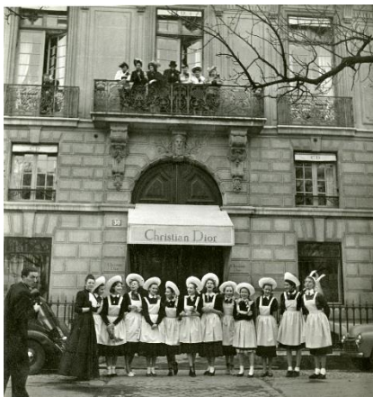
Les Catherinettes devant le siège de la Maison Dior, 30 avenue Montaigne, Paris