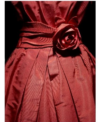
Robe Manuela en faille de soie corail ornée d'une rose de même tissu à la ceinture, collection Haute Couture printemps-été 1959, ligne Longue, Christian Dior par Yves Saint-Laurent. Collection musée Christian Dior, Granville.

61 modèles. Tous issus de la maison Dior, ils illustrent le travail de Christian Dior, mais aussi de ses successeurs, d'Yves Saint Laurent à Maria Grazia Chiuri. Pour « Dior en roses », deux modèles des collections Dior Homme étaient présentés.