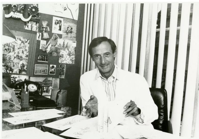
Marc Bohan à son bureau, dans les années 70-80. Collection Musée Christian Dior, Granville

En 2009, le musée Christian Dior rendait hommage à la force créative du couturier à l'occasion de l'exposition « Dior - Les Années Bohan, trois décennies de styles et de stars » et, plus récemment, dans l'exposition « Grace de Monaco, Princesse en Dior ». En effet, Marc Bohan cultivait de nombreuses amitiés avec les célébrités, dont la princesse de Monaco qu'il habilla pour ses rendez-vous officiels, les bals, mais aussi des événements plus intimes. Il fit d'elle la marraine emblématique de la marque Baby Dior à sa création.