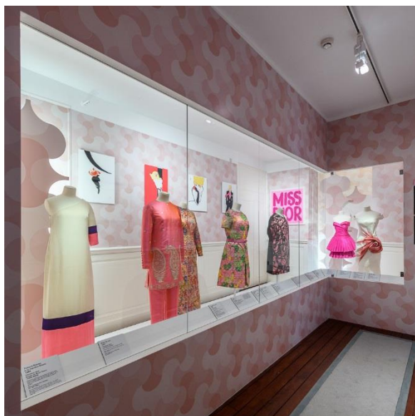
L'exposition « Dior en roses », présentée jusqu'au 31 octobre 2021

A partir du 1 er octobre, les horaires d'ouverture du musée Christian Dior changent. Les visiteurs pourront découvrir l'exposition « Dior en roses » du mardi au dimanche, de 10h à 12h30 et de 14h à 18h (dernières entrées à 12h et 17h30). Durant les vacances scolaires de la Toussaint, le musée granvillais sera ouvert aux mêmes horaires, tous les jours de la semaine.