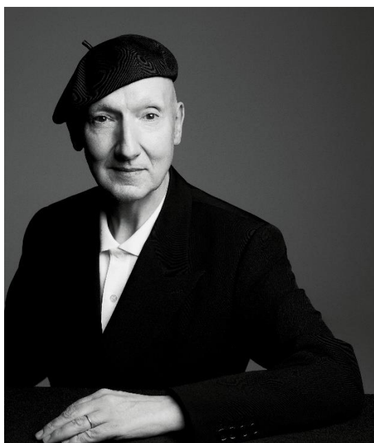
Stephen Jones, directeur artistique des Chapeaux Dior

Une visite commentée en présence de Stephen Jones