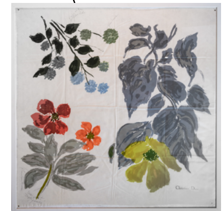
Foulard carré frangé en sergé de soie blanc, à motifs floraux.

Annotations de la main de Christian Dior donnant des indications de confection